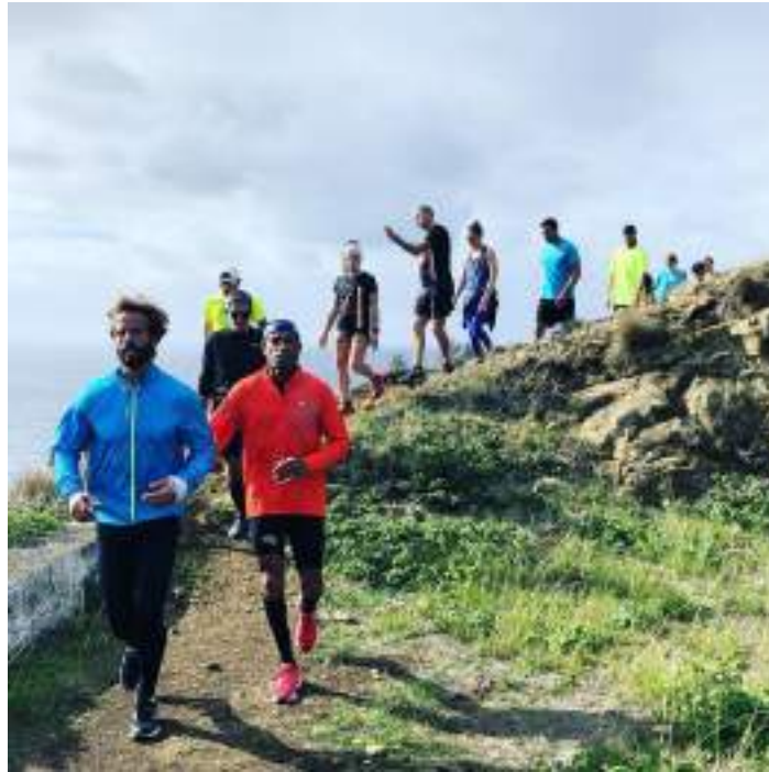
18 DE NOVEMBRO – Participação da Jornada Octakids no Estádio Universitário